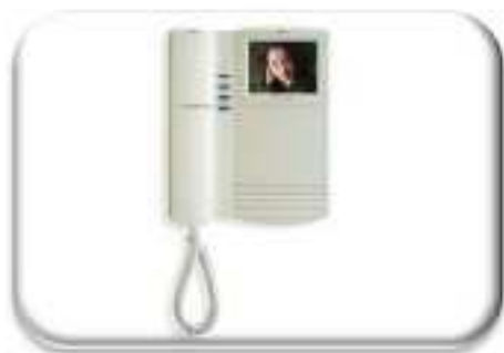
电子设备及元器件